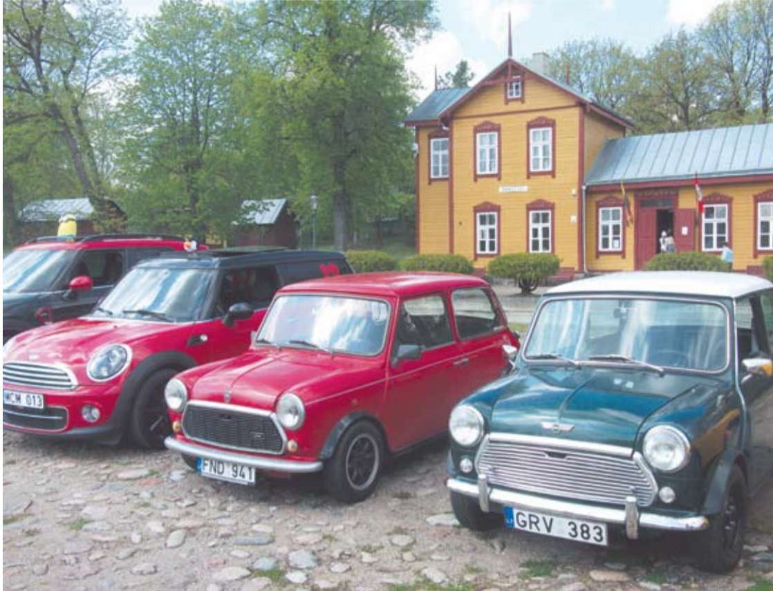
Mažieji automobiliukai aikštėje prie Anykščių geležinkelio stoties.

Paradas miesto gatvėmis, mitingas didžiojo akmeninio grindinio aikštėje prie Siauruko stotelės ir pietūs užėjoje „Mandri puodai“ – tokią programą skelbiantis klubas pajvairins šilto savaitgalio žadamus malonumus.