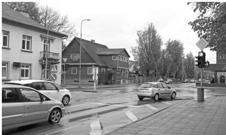
Prie pakeistų šviesoforų sutriko ne vienas vairuotojas.

Priminsime, kad 2020 metais buvo nuimtos visos metalinės