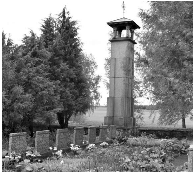
Architekto Broniaus Kazlausko suprojektuotas originalus paminklas primena varpinę.

Apie šį radinį policijai pranešta apie 15.33 val. Pradėtas ikiteisminis tyrimas mirties priežasčiai nustatyti.