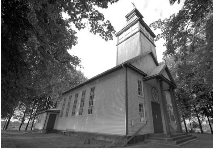
Užunvėžių bažnyčia bus naujai perdažyta.

Sakralinio paveldo objektams tvarkyti šiais metais iš Anykščių rajono savivaldybės biudžeto skirta 30 tūkst. Eur. Už šiuos pinigus rajone bus atliekami bažnyčių bei cerkvių remonto darbai.