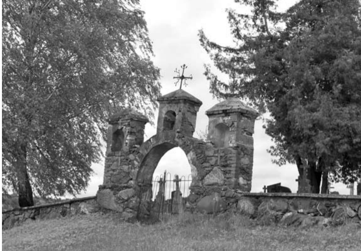
Už šių vartų septynių Drobčiūnų miške žuvusių partizanų kapai Kunigiškių kapinėse. Juos žymi vienodi antkapiniai paminklai.

Gegužės 15 dieną, šeštadienį, Svėdasų seniūnijos Kunigiškių I kaime, kapinėse, partizanų kape, kelių centimetrų gylyje, rasta žmogaus kaukolė ir du kaulai.